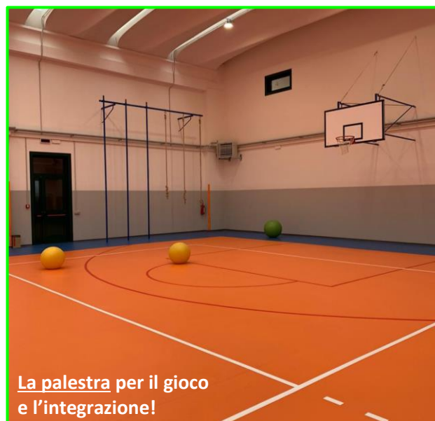
La palestra per il gioco e l'integrazione!